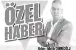
Haber: Melih DEMİNOĞLU

“Hiç kimse başım merdivenine elleri cebinde tırmanmamıştır.”