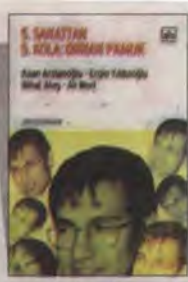
5. Sanattan 5. Kola: Orhan Pamuk Kaan Arslanoğlu, Ergin Yıldızoğlu, Ali Mert ve Nihat Ateş İthaki Yayınları 157 sayfa

■ Bir yanda uluslararası alanda kültür çevreleri nezdinde itibarlı bir yer edindi Orhan Pamuk. Diğer yanda yaptığı açıklamalar nedeniyle, çok sert eleştirilere maruz kaldı, "Türklüğü ale-