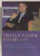
Orhan Pamuk Edebiyatı Sabancı Üniversitesi Sempozyum Tutanakları Agora Kitaplığı 179 sayfa

Engin Kılıç (Sabancı Üniv. Öğr. Üyesi) :Postmodern yönelimlerin edebiyata yaptığı en büyük katkı, bir anlamda ona özerkliğini ve diğer disiplinlerin verilerini kendi mimarisi için kullanabilme, hatta bazen suistimal edebilme özgürlüğü vermesi. Ayrıca metinlerarası kavramı sayesinde edebiyatı büyük anlatıların hizmetkarı olmaktan ve dış gerçeklik hakkında değer yargıları ortaya koyma riskinden kurtarması. Pamuk'un da bu imkanlardan sonuna kadar yararlandığını söyleyebilirim. ■