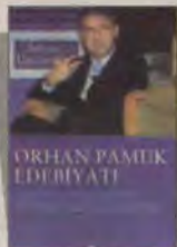
Orhan Pamuk Edebiyatı Sabancı Üniversitesi Sempozyum Tutanakları Agora Kitaplığı 179 sayfa

Engin Kılıç (Sabancı Üniv. Öğr. Üyesi) :Postmodern yönelimlerin edebiyata yaptığı en büyük katkı, bir anlamda ona özerkliğini ve diğer disiplinlerin verilerini kendi mimarisini için kullanabilme, hatta bazen suistimal edebilme özgürlüğü vermesi. Ayrıca metinlerarası kavramı sayesinde edebiyatı büyük anlatıların hizmetkarı olmaktan ve dış gerçeklik hakkında değer yargıları ortaya koyma riskinden kurtarması. Pamuk'un da bu imkanlardan sonuna kadar yararlandığını söyleyebilirim. ■